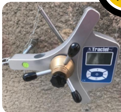
Dynaplug, appareil pour tester des points d'ancrage à l'arrachement

Les techniciens cordistes installent les sécurités collectives (gardes corps, ligne de vie, point d'ancrages, échelle à crinoline) mais les vérifient également, ce qui est une obligation ! (Article R4534-85)